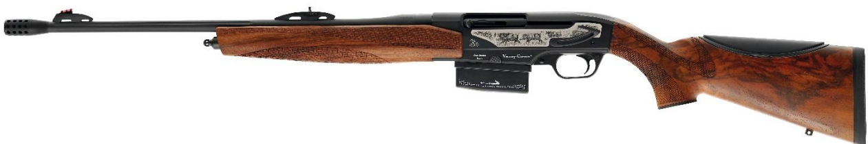
Modèle "gaucher intégral"